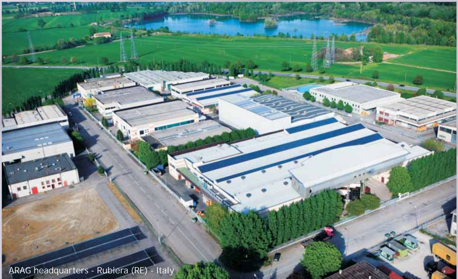
ARAG headquarters - Rubiera (RE) - Italy

ARAG ARGENTINA s.a. AV. PELLEGRINI 6530 2000 ROSARIO - SANTA FE Tel. +54 341 458-3838 email: info@aragnet.com.ar